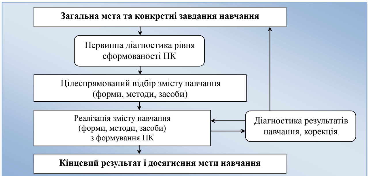
Рис. 1. Структурна схема технологічної побудови освітнього процесу

Технологія формування у майбутніх кваліфікованих робітників сфери послуг підприємницької компетентності, яка має визначені мету й завдання, методологічні засади, принципи, містить такі етапи впровадження: